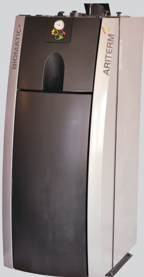
Ariterm Biomatic+ 20i