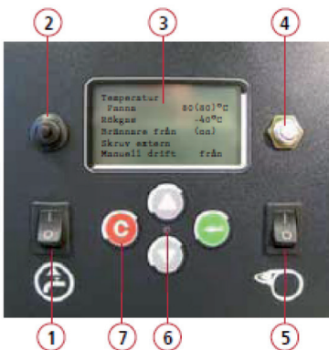
Styrenhet Biomatic+ 20/40