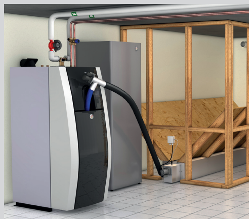
Ariterm Biomatic+ 20 i kombination med Ariterm Feedo och Ariterm Depo.

Ariterm Biomatic+ 20i / 40i med WiFi/ Internetkoppling möjliggör styrning via PC, läsplatta eller en smart telefon.