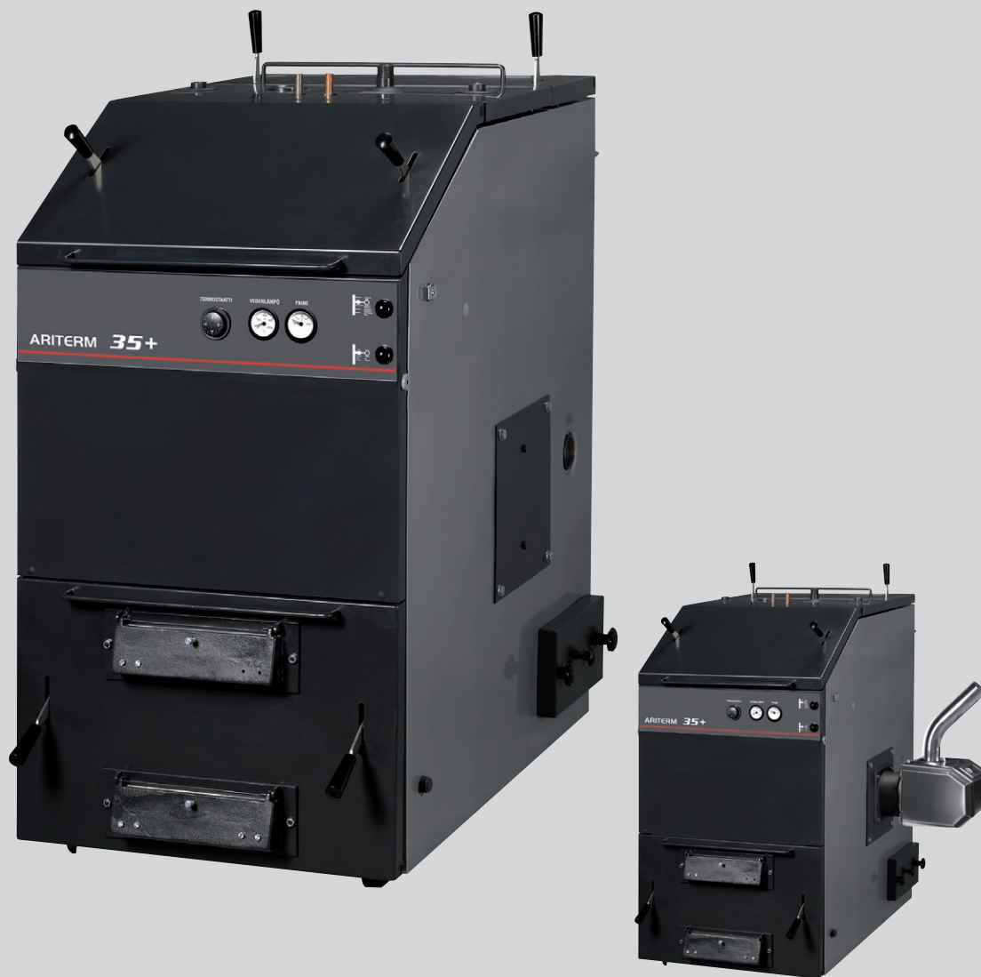
Ariterm 35+ kompletterad med pelletsbrännare KMP PX22.